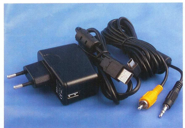
Zolid levert een kabel voor de televisie mee