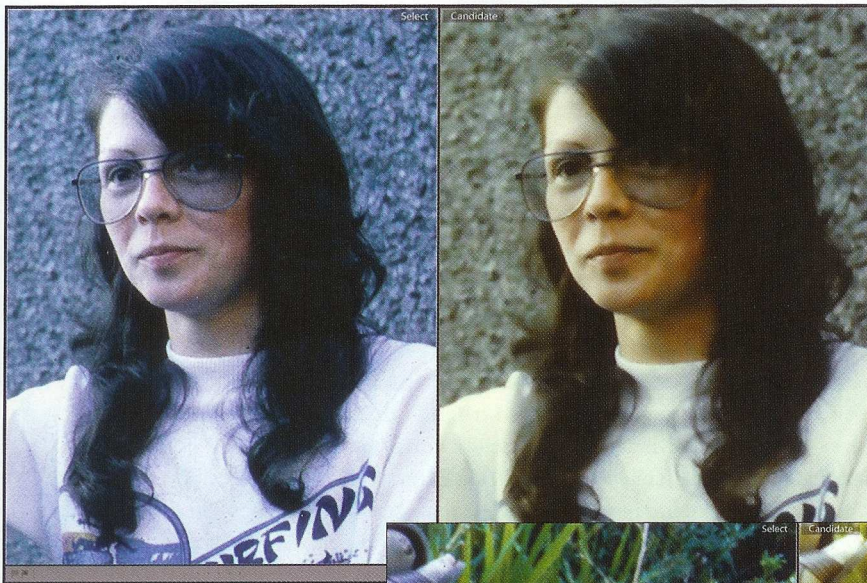
⊕ Bij deze twee foto's ziet u links steeds de dia gescand met de Reflecta DigitDia 5000 en rechts de dia gescand met de Zolid

bruiksaanwijzing was helder en gedetailleerd. Scannen gaat snel, in vier seconden is het al gepiept. De interface is even wennen. Omdat er simpelweg wat weinig knoppen zijn, moet u door allerlei niet overdreven duidelijke iconen wandelen. Dat had mooier gekund, met tekst op het scherm, maar dat kost natuurlijk extra tijd in de ontwikkeling en bovendien moet er dan meer geheugen worden ingebouwd.