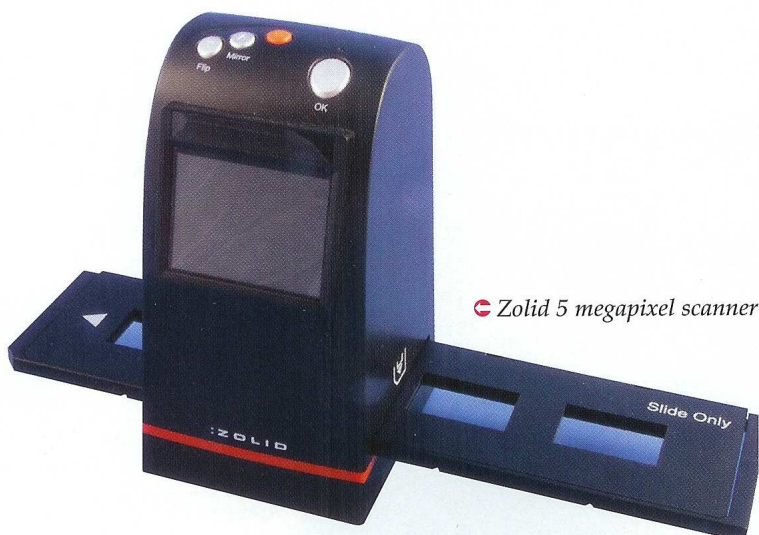
Zolid 5 megapixel scanner

Binnen enkele minuten na het uitpakken maken we alvast de eerste scans. De Nederlandstalige hulplijn was niet nodig, de eveneens Nederlandstalige ge-